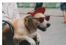
Hund & förare